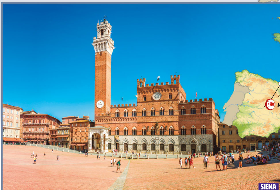
DONDE TENEMOS OPORTUNIDAD DE CONOCER LA MARAVILLOSA PLAZA DEL PALIO. DETALLE DE LAS ESCULTURAS DE LA CATEDRAL DE SIENA.